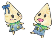
【インディちゃん・ゴーくん】 TMさん作