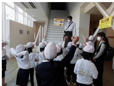
1・2年生 県立図書館・ハレルヤスイーツキッチン

11月9日（水）にバス遠足がありました。各学年、教室とはまた違う学びをしてきました。