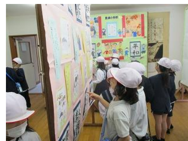
人権文化祭の見学