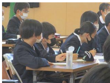
講話を聞く真剣な眼差し